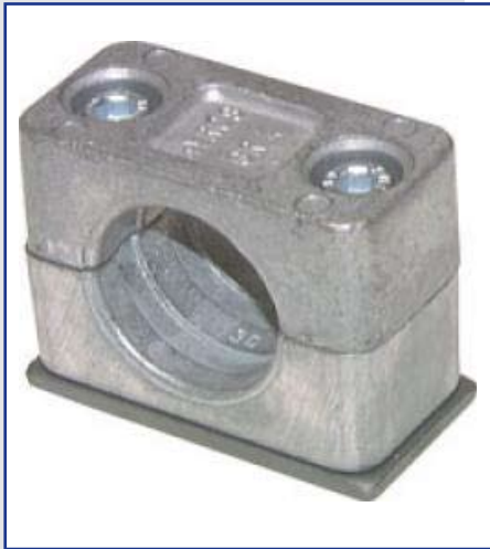
Arttkelname: Rohrschelle Aluminium Art.-Nr.: GRXLALU00000