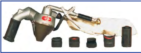
Educt-O-Matic Art.-Nr. 18990590282D