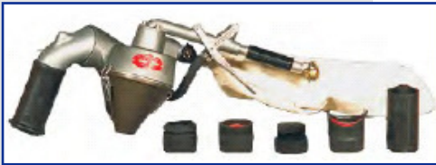
Educt-O-Matic Art.-Nr. 18990590282D