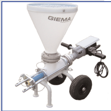
TP 2 Minipumpe Art. Nr.: